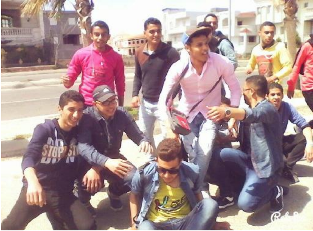
على شاطئ الخليج