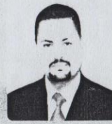
رئيس كلية الزراعة أ.د/ محمد الشربييني