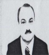
رئيس كلية الزراعة أ.د/ محمد الشربييني