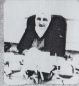
رئيس كلية الزراعة أ.د/ محمد الشربييني