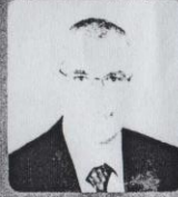
رئيس جامعة الزقازيق أ.د/ خالد الدرداوي