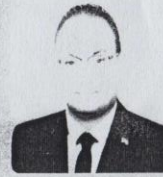
رئيس كلية الزراعة أ.د/ محمد الشربييني