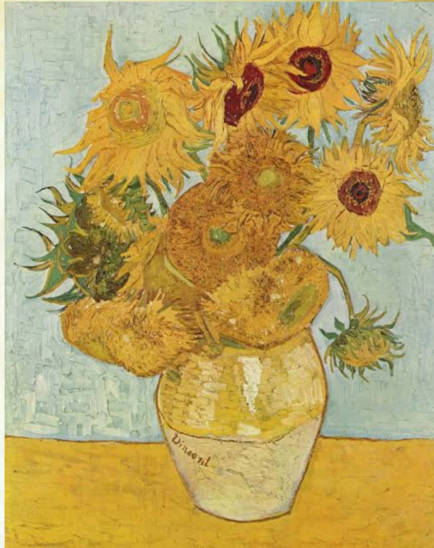
لوحة الفنان فنسنت فان جوخ